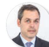
Alessandro Caltagirone Immobiliare Caltagirone