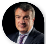
Giuseppe Crupi Abitare Co.