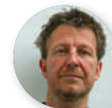
Cino Zucchi CZA Cino Zucchi Architetti