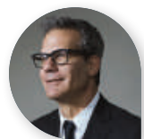
Richard L. Florida Toronto University