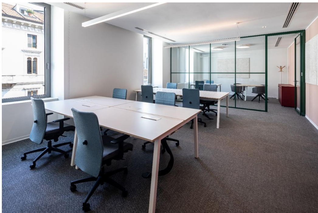
Wellio Dante interni uffici

Wellio è l'innovativa offerta di pro-working di Covivio, concepita per offrire un'esperienza lavorativa all'avanguardia ai professionisti in cerca di flessibilità ed elevati standard di lavoro. Il nuovo concept ha aperto il suo primo sito a Milano a fine agosto 2020 in via Dante 7 e nella primavera 2022 il secondo spot milanese a pochi passi dal Duomo, all'angolo tra via Torino e via dell'Unione.